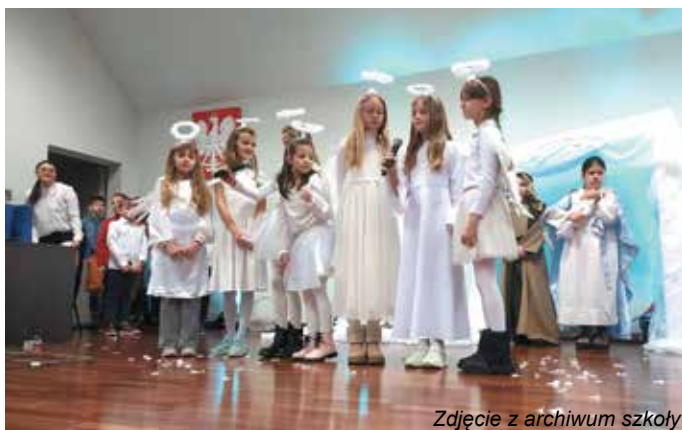
Zdjęcie z archiwum szkoły