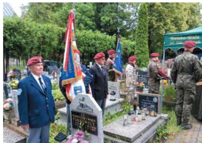
Poczty sztandarowe / uroczystość pogrzebowa