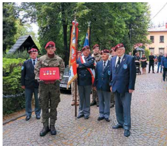
Asysta Honorowa WP i Spadochroniarzy przed kościołem

Był żołnierzem - spadochroniarzem ds. zadań specjalnych, czyli bardzo trudnych, wymagających dużo sprytu, cierpliwości i wytrwałości. Wykonywał skoki ze spadochronem, był koleżeńskim i dobrym żołnierzem. Po odbyciu zasadniczej służby powrócił do pracy w EC - 1, jako specjalista energetyk ostatnie lata pracował „na