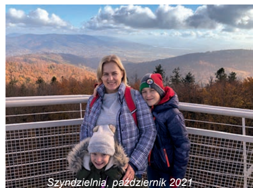
Szyndzielnia, październik 2021