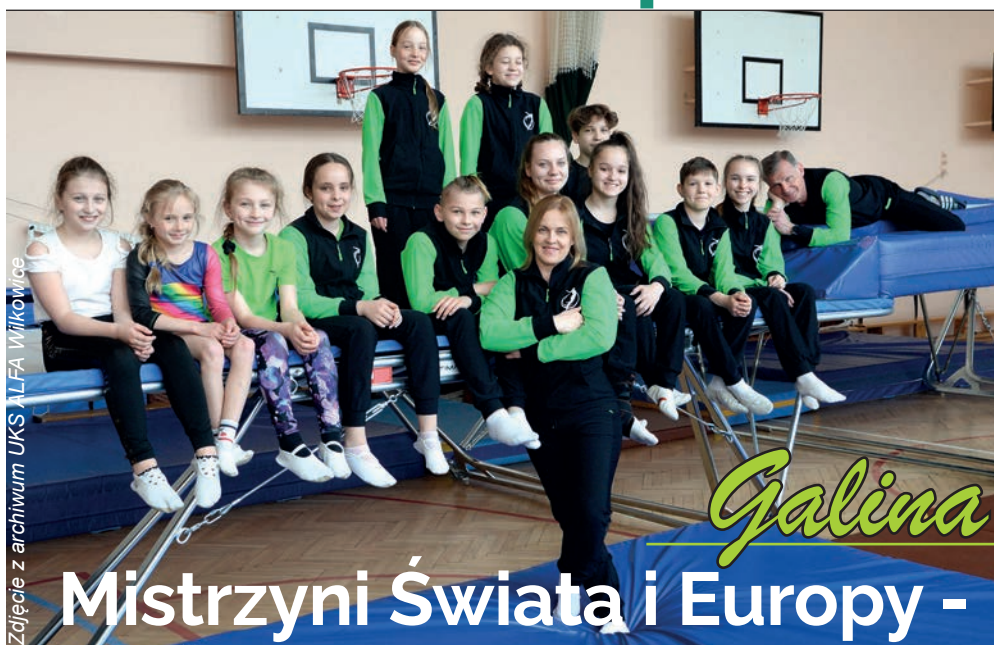
Zdjęcie z archiwum UKS ALFA Wilkowice