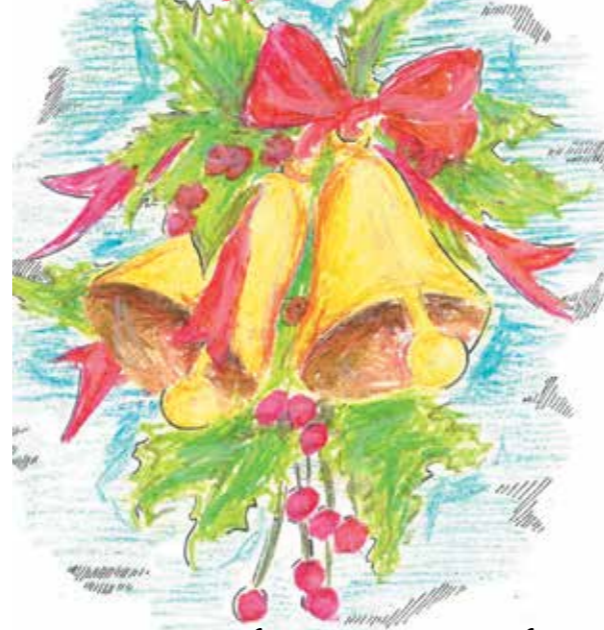
Grafika na podstawie pracy Angeliny Segut zgłoszonej do konkursu na Najpiękniejszą Kartkę Bożonarodzeniową

Na szczęście, na zdrowie, na ten Nowy Rok! Coby Wam niczego nie chybiało, Z roku na rok przybywało, A do reszty - cobyscie byli szczęśliwi i weseli Jako w niebie anieli, hej!