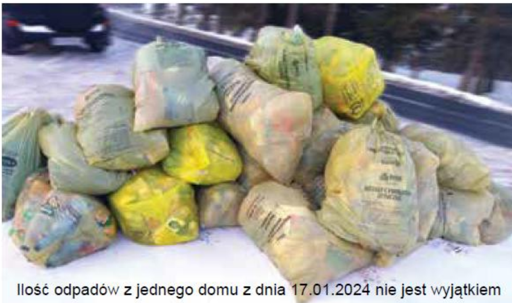
Ilość odpadów z jednego domu z dnia 17.01.2024 nie jest wyjątkiem

Nowe rozwiązania, które przedstawię i postaram się uzasadnić poniżej, zapewne nie powstrzymają wzrostu opłaty za odpady w kolejnych latach, ale bez żadnych wątpliwości spowodują stabilizację trendu, wyłączając tytułowego „autopilota” wzrostu cen.