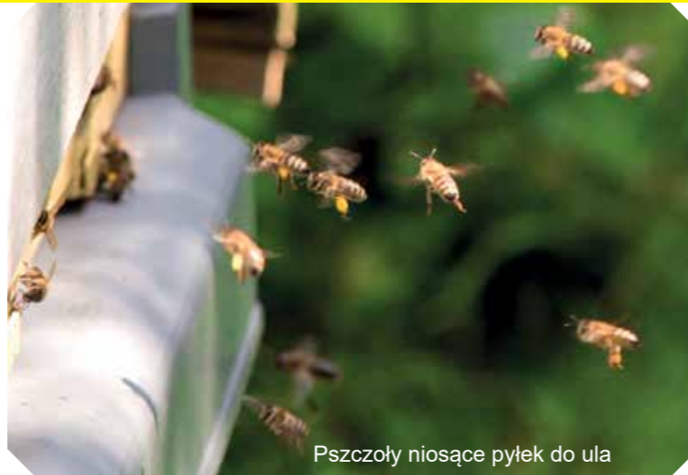
Pszczoły niosące pyłek do ula

Staram się mieć rasę i linię pszczół, które bazują właśnie na spadzi iglastej. „Alpejskie” linie (bo selekcyjonowane są w Alpach austriackich), przede wszystkim bazują na lasach, a tutaj lasów mamy sporo, bo aż pod Klimczok, w Bystrej jest dużo lasów, w Wilkowicach aż pod Magurkę. Pszczoły z linii alpejskiej potrafią przemieszczać się nawet do 10 km (jeżeli byłby głód, w poszukiwaniu pokarmu). Z takiej odległości niewiele przyniosą, ponieważ zużyją w locie, ale przeżyją. Najbardziej ekonomiczny lot odbywa się w odległości około 3-4 km. Przy dużej liczbie pszczół i przy ich długowieczności (takiej, jak mają moje pszczoły) są w stanie zgromadzić zapasy nawet z odległości 5-6 km. Było tak, że przynosiły spadź jodłową do Wilkowic aż z Górnej Bystrej. Rośliny „nektarują” różnie, czasem co roku, czasem nie, czasem bardziej, czasem mniej. Tak samo jest ze spadzią. Musi zaistnieć wiele czynników, które złożą się na ilość miodu spadziowego. Najlepiej, żeby sok z jodły, świerka czy modrzewia, miał w składzie mało białka, a dużo cukru - wtedy mszyce czy czerwce, które się nim odżywiają, muszą „przepuścić przez siebie” więcej pokarmu, zużywając z niego tylko białko, a wytwarzając więcej słodkiej spadzi.