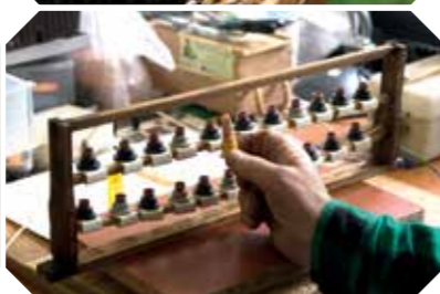
Miejsce hodowli matek