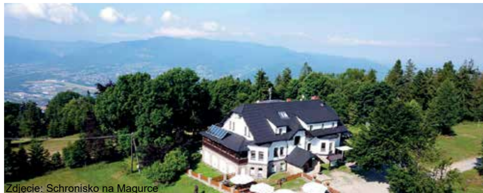
Zdjęcie: Schronisko na Magurce

Czy kiedykolwiek zastanawialiście się, jak to jest stanąć w miejscu, gdzie odbyły się emocjonujące sceny filmowe? Czy marzyliście o podążaniu śladami ulubionych bohaterów na ekranie? Jeśli tak, mamy dla Państwa niesamowitą okazję! Zapraszamy Was do udziału w plebiscytcie na najlepszą lokację filmową na Śląsku.