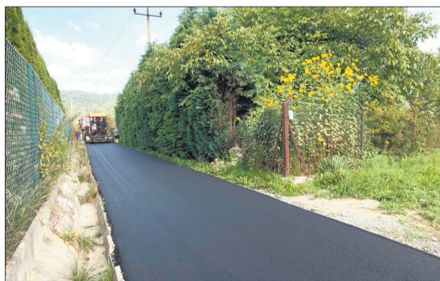
W następstwie prowadzonych prac związanych z projektem kolejne odcinki dróg na terenie gminy Wilkowice zyskały m.in. nowe nawierzchnie asfaltowe.

wiły ok. 3,8 mln zł, wliczając w tę kwotę niemal 800 tys. zł na dodatkowe roboty nieujęte w projekcie, a więc m.in. wykonanie nawierzchni asfaltowych w miejscach, gdzie pierwotnie nie były przewidziane, odwodnienia przy drogach czy konieczne wykupy gruntów. Całkowite wydatki roczne związane z projektem to ok. 15 mln zł, co stanowi 71 proc. wykonania wydatków inwestycyjnych budżetu Gminy. (MA)