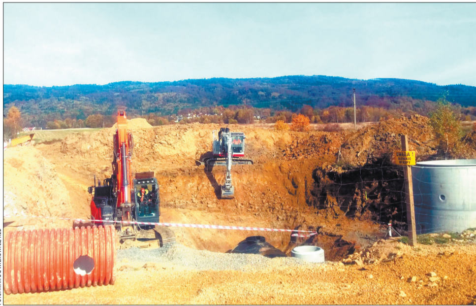
Najważniejszym elementem inwestycji w mijającym roku była budowa sieciowych pompowni ścieków w dwóch lokalizacjach w Wilkowicach. Roboty ziemne objęły m.in. wykonanie skomplikowanych głębokich wykopów.

Wraz z rozwojem sieci możliwe stało się realizowa-