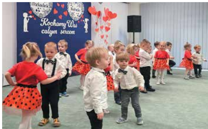
Wszystkie zdjęcia z archiwum przedszkoli

W ostatnich dniach stycznia w naszym przedszkolu odbyły się uroczystości z okazji Dnia Babci i Dziadka. W pięknej scenografii oraz wyjątkowej atmosferze przedszkolaki zaprezentowały swoje umiejętności recytatorskie, wokalne i taneczne, a następnie wręczyły babciom i dziadkom prezenty, aby choć w tak skromny sposób podziękować im za opiekę, okazywaną miłość, cierpliwość i zrozumienie. To były naprawdę wyjątkowe chwile - pełne uśmiechu, radości i dumy. Szczęśliwe i rozpromienione twarze babć i dziadków dały wyraz tego, jak ważne są takie spotkania i chwile spędzone wspólnie z wnukami. Wszystkim Rodzicom, którzy zaangażowali się w przedsięwzięcie, składamy serdeczne podziękowania. Dziękujemy również wszystkim Babciom i Dziadkom za tak liczne przybycie i jeszcze raz wszystkim składamy najserdeczniejsze życzenia zdrowia i wszelkiej pomyślności z okazji Ich święta.