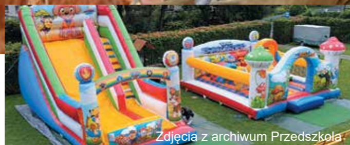
Zdjęcia z archiwum Przedszkola

Dbając o zdrowie i czyste środowisko, jesień powitaliśmy uczestnicząc w 31. Akcji Sprzątania Świata organizowanej przez Fundację Nasza Ziemia. Dzieci utrwały nawyki proekologiczne segregując i wkładając śmieci do odpowiednich pojemników. Krasnoludki i Robaczki porządkowały ogród i najbliższe otoczenie, natomiast Jeżyki i Ogniki - ulubione miejsca spacerów: park i uliczki wokół przedszkola. Wszyscy pamiętali o zasadach bezpieczeństwa – rękawiczki ochronne miał każdy. Zasady bezpiecznego zachowania się na drodze przedszkolaki utrwały również podczas przedstawienia „Smerfuj bezpiecznie” w wykonaniu Teatru Blaszący Bębenek. Znaczenie znaków drogowych i sygnalizatora oraz sposób bezpiecznego przechodzenia przez jezdnię, przedstawione przez postacie Smerfów i Gargamela, na pewno zostaną zapamiętane.