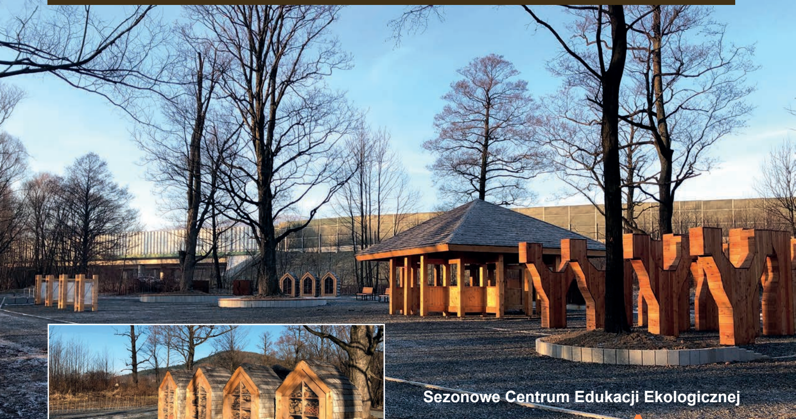
Sezonowe Centrum Edukacji Ekologicznej