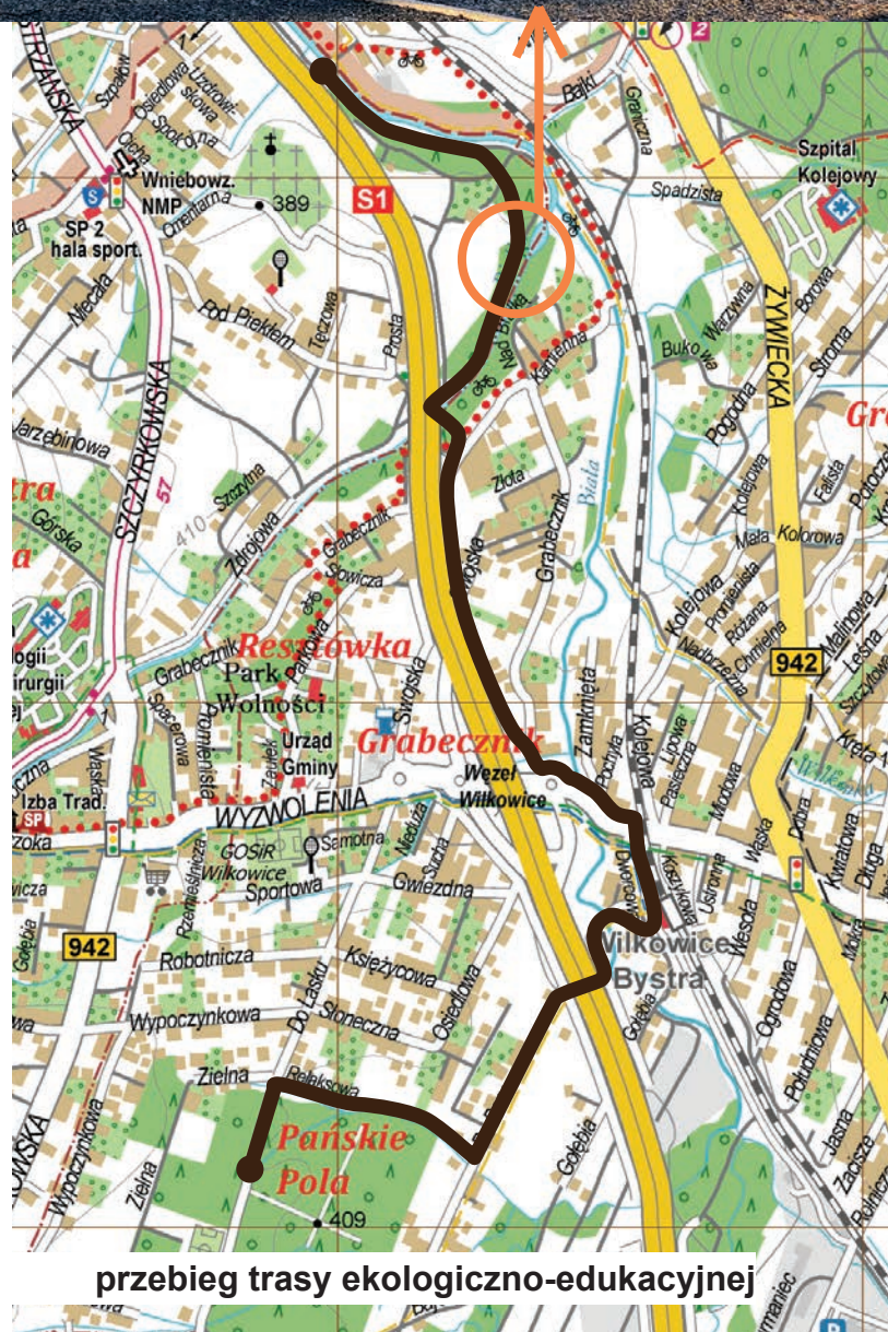
przebieg trasy ekologiczno-edukacyjnej

Dokumentacja projektowa tego przedsięwzięcia powstała w 2018 roku. W grudniu 2019 roku podpisana została umowa o dofinansowanie inwestycji. Na obecnym etapie ukończono dwa z trzech działań w zakresie wykonania obiektów budowlanych oraz działania przyrodnicze. W bieżącym roku planowana jest budowa centrum edukacji ekologicznej oraz prowadzenie działań edukacyjnych. UG