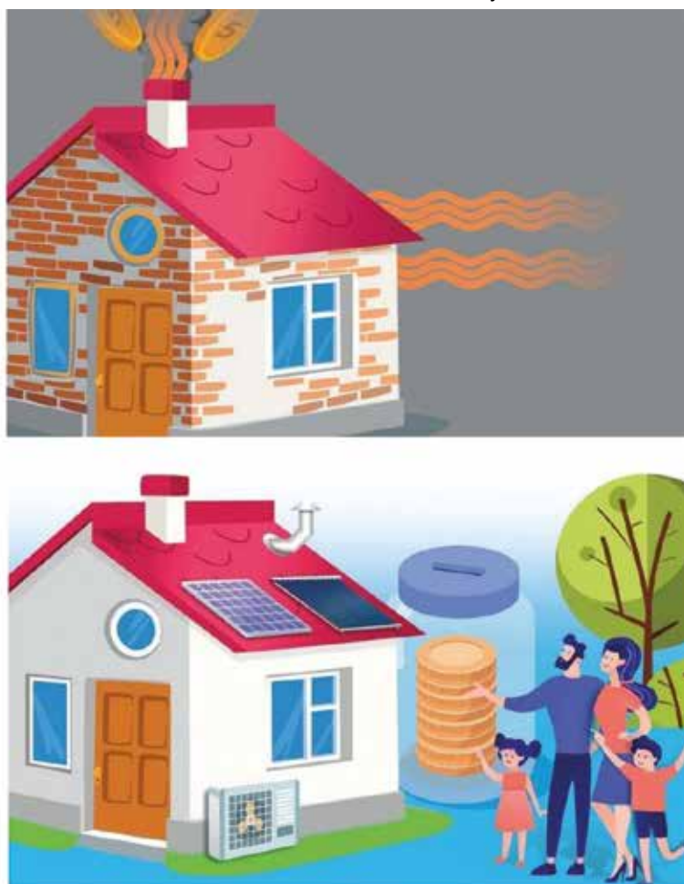
Grafika na podstawie termomodernizacji domu w programie Czyste Powietrze