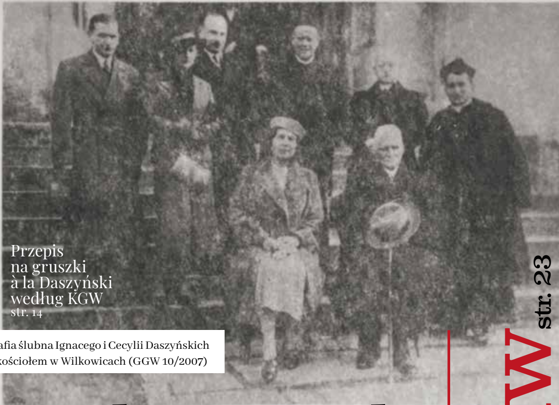
Przepis na gruszki à la Daszyński według KGW str. 14