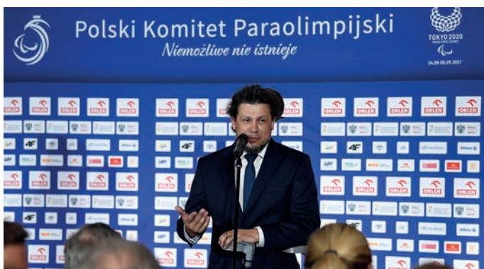
2021.07.15 Konferencja prasowa „40 dni do Tokio”