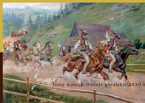
Jerzy Kossak, Wesele góralskie, 1930 r.