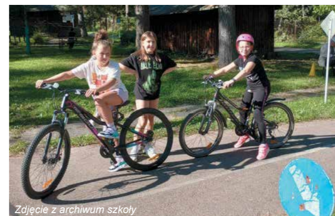
Zdjęcie z archiwum szkoły