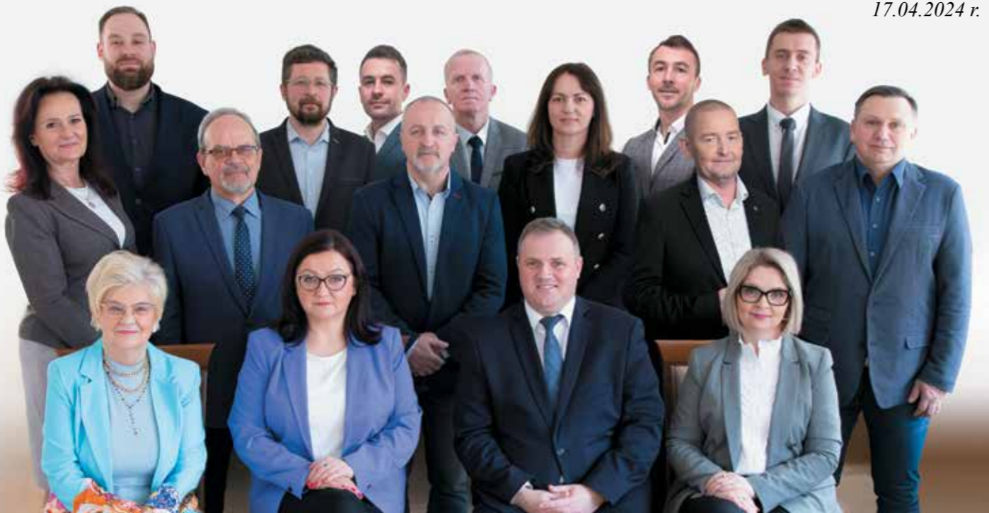
Rada Gminy Wilkowice kadencja 2018-2024