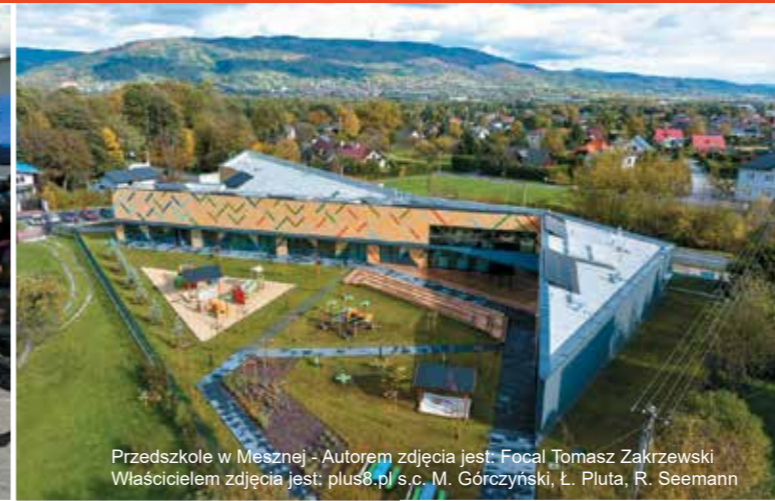
Przedszkole w Mesznej