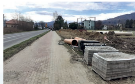
Prace budowlane na ulicy Agrestowej

O szczegółowy opis tej inwestycji poprosiliśmy biuro projektowe „Archikunszt Studio” Anna Sierant, które jest autorem projektu architektonicznego: