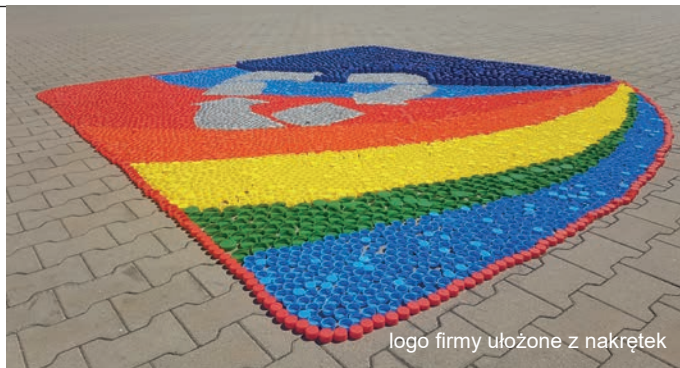
logo firmy ułożone z nakrętek

W ślad za rozwojem floty samochodowej, powiększa się także park maszynowy na terenie obiektu w Wilkowicach.