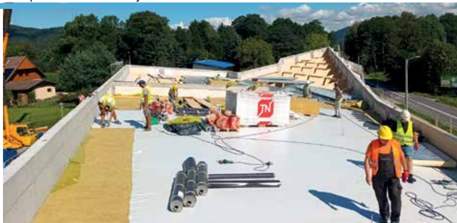
Dach przedszkola w Mesznej