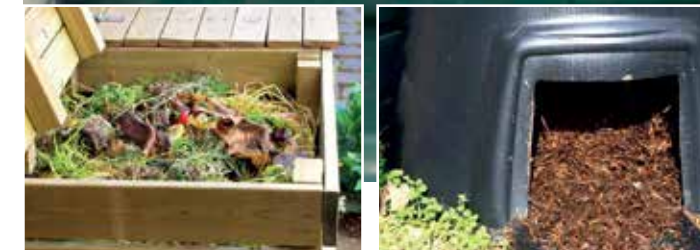
Ministerstwo Klimatu i Środowiska, kampania Piątka za segregację, strona internetowa: naszesmieci.pl